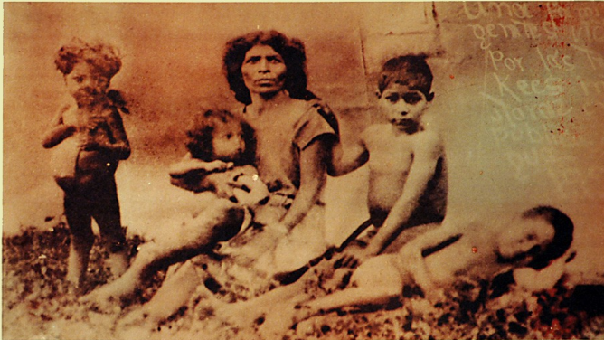
"Una familia de indigentes víctimas de las tropas yankees en la República de Nicaragua., 1928"

Con qué altivez se yergue desde donde está echada, con mirada fosforescente, lista a saltar sobre cualquiera, en defensa de lo único que le han dejado: sus cachorros, "hijos de Sandino".